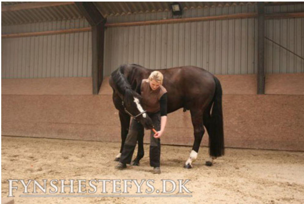
Øvelse 5: Stå ud for hestens gjordleje.