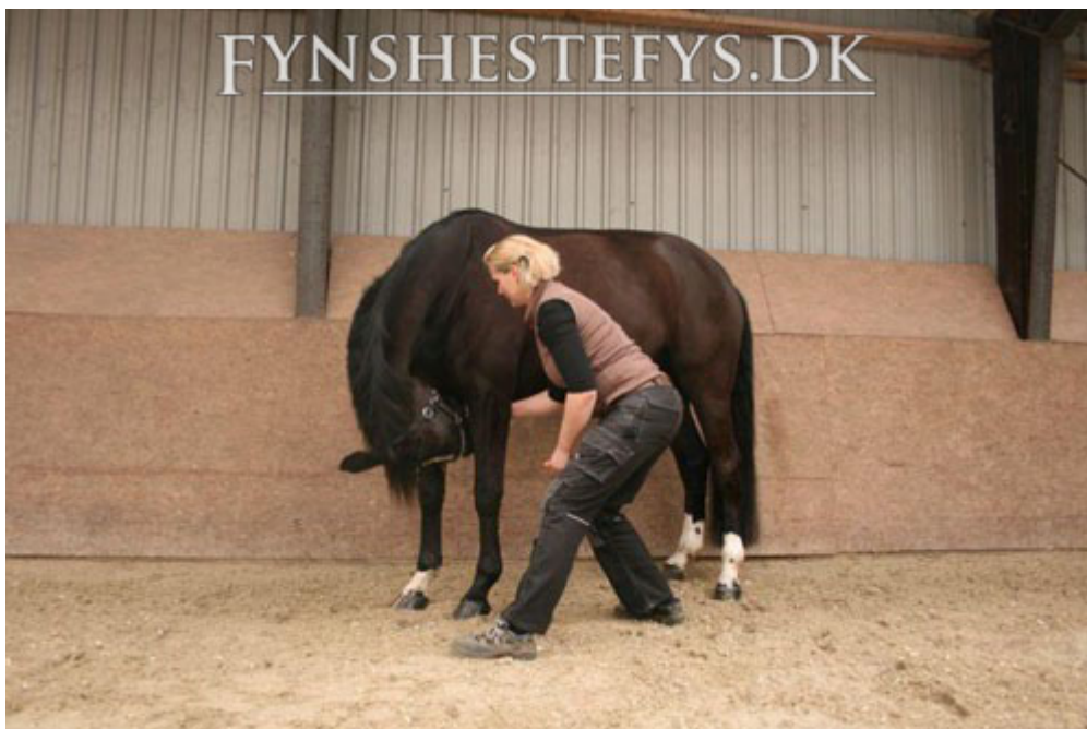
Øvelse 1 – hestens mule til bringen. Øvelsen træner primært nakken og halsen.

Øvelserne bør udføres på et plant, jævnt underlag, hvor hesten ikke kan glide. Nogle heste har lettere ved at lave øvelserne, hvis den kan støtte sig op ad en væg. Hesten bør stå i "square" – med benene ved siden af hinanden, men ofte flytter hesten sig under øvelserne. Pas på dine egne fødder. Det kan være en fordel at have sikkerhedssko på.