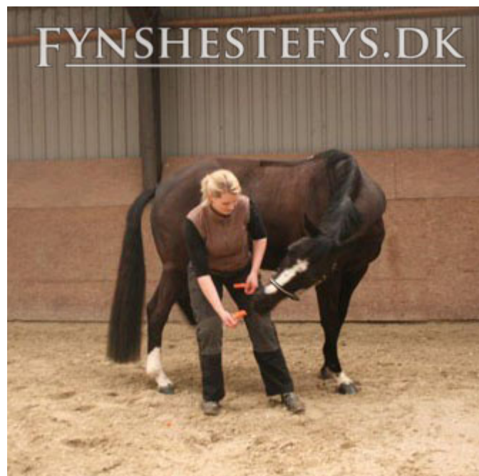
Øvelse 6: Stå ud for hestens lyske. Enkelte heste kan finde på at løfte indvendige bagben, som det ses på billede 3. Det skyldes, at hesten kipper sit bækken. Bemærk, hvor forskelligt hesten holder sit hoved på de to billeder. På det første billede roterer hesten sit hoved. Stillingen af hestens hoved på billede 3 er at foretrække i alle lateralfleksionsøvelser.